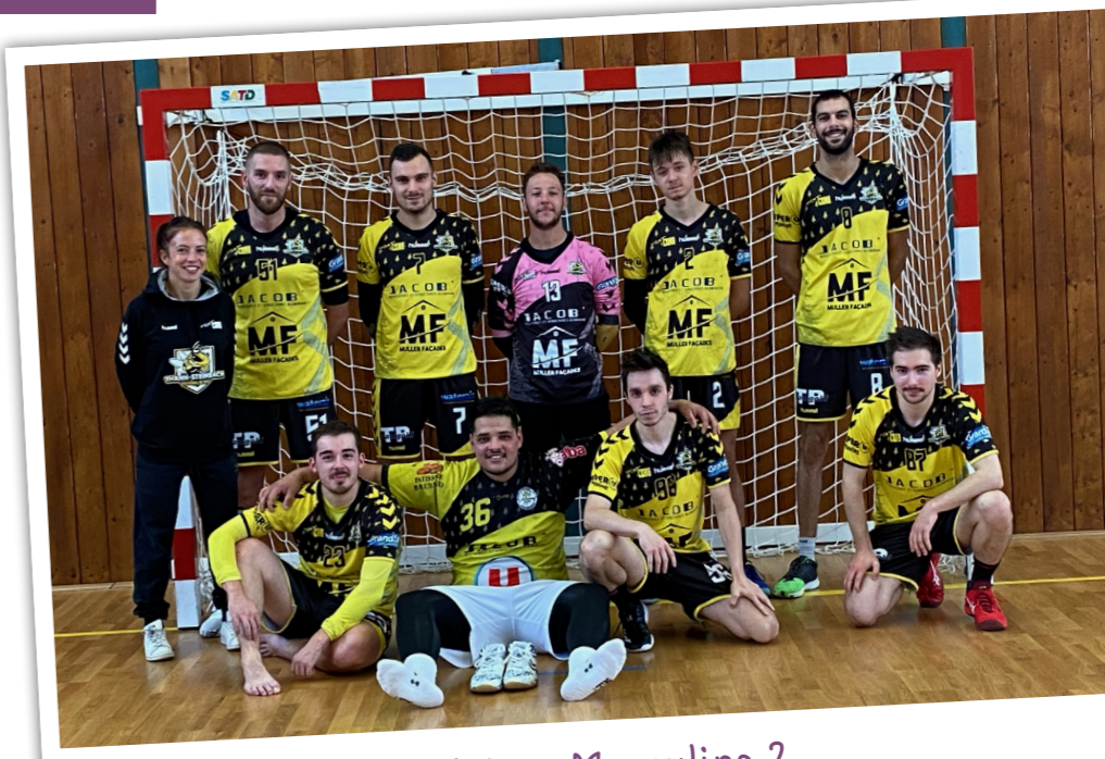
Séniors Masculins 2