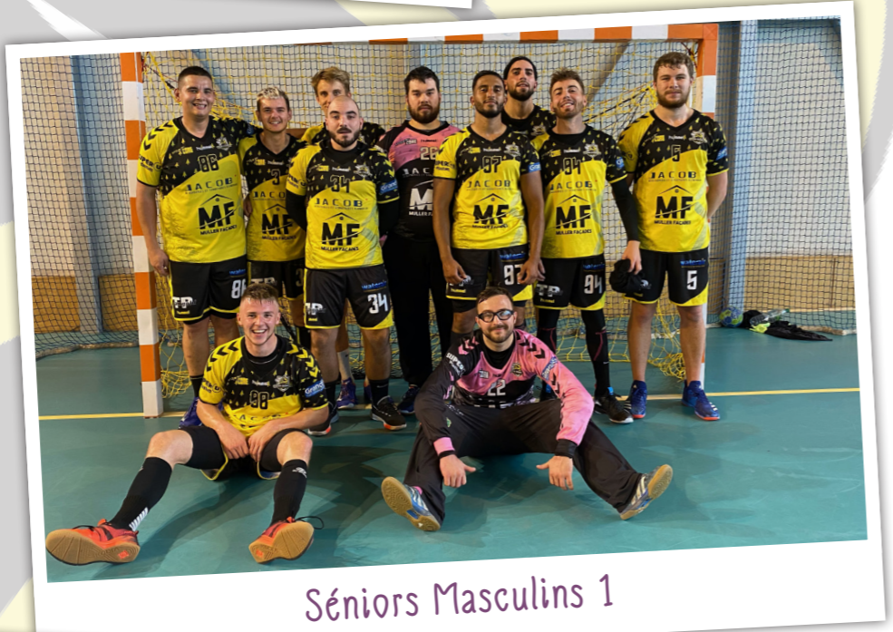
Séniors Masculins 1