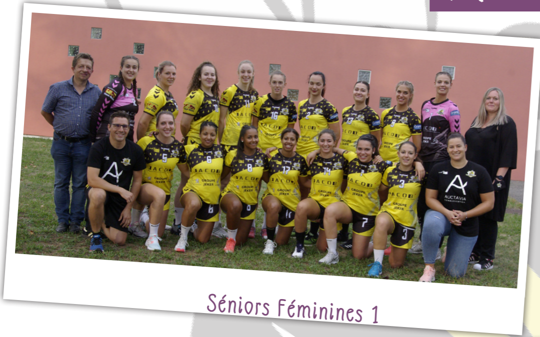
Séniors Féminines 1