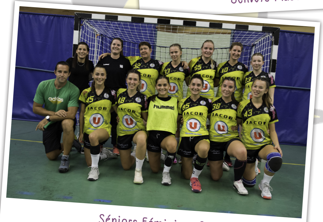
Séniors Féminines 2